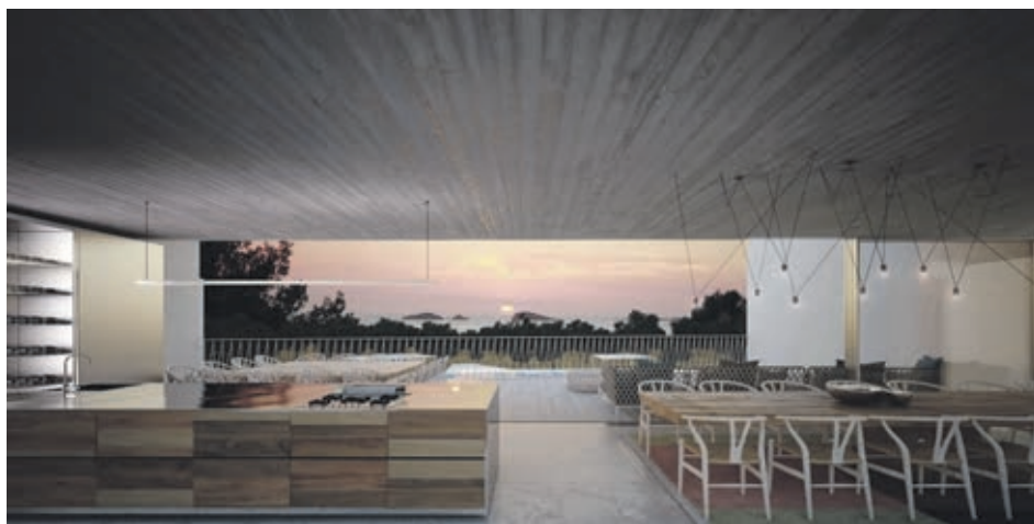
Villa unifamiliare, Cala Conta, Ibiza, Spain

In ambito architettonico un'ormai diffusa consapevolezza riconosce come valore irrinunciabile la sostenibilità ambientale, e contribuisce a mettere a fuoco un concetto più ampio di qualità edilizia e urbana. Su questo fronte lo Studio Capucci , realtà storica attiva fin dai primi anni del secolo scorso, rinnova e consolida il suo approccio alla